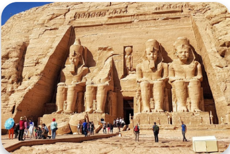
معبد أبو سمبل