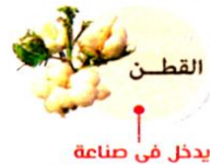
يدخل في صناعة