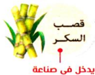
يدخل في صناعة