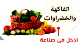
تدخل في صناعة

(٤) توفر رأس المال فهي تساهم في انشاء المشروعات .